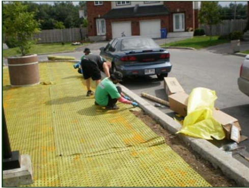
Mise en place du Biobarrier.