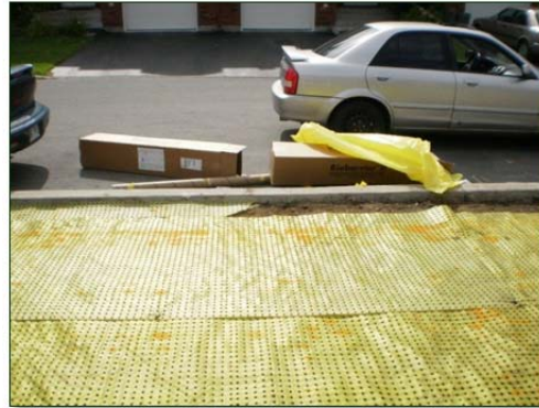
Attaches de plastique pour sécuriser la membrane en place.